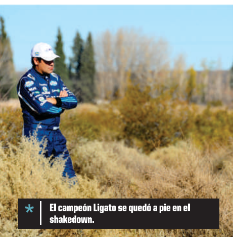
* El campeón Ligato se quedó a pie en el shakedown.