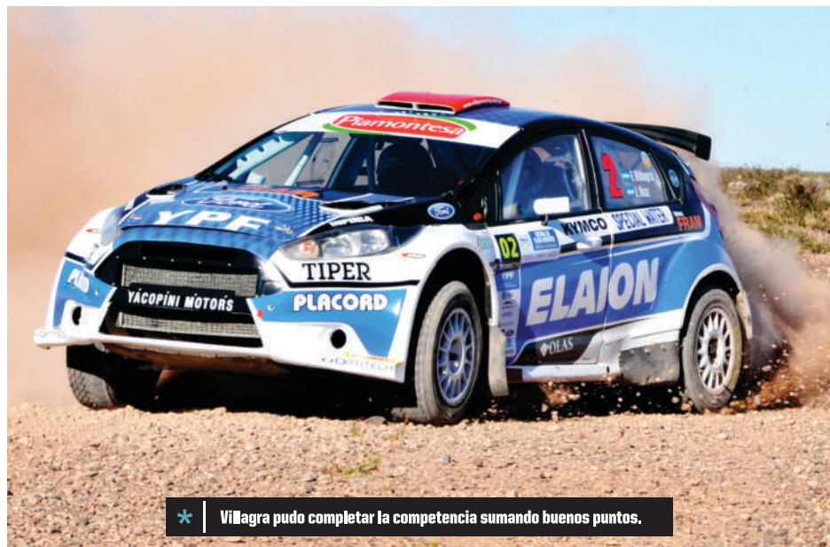
* Villagra pudo completar la competencia sumando buenos puntos.