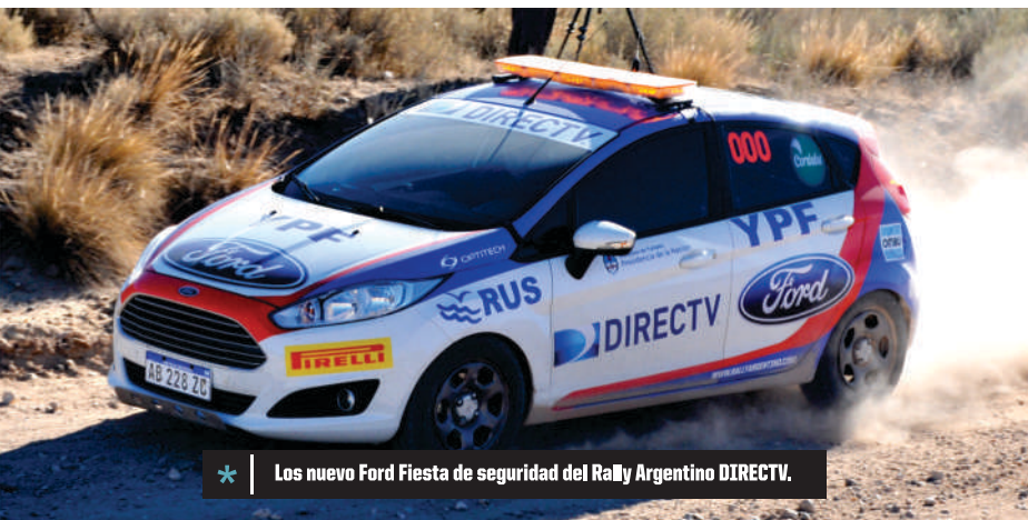
* Los nuevo Ford Fiesta de seguridad del Rally Argentino DIRECTV.