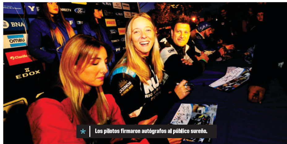
* Los pilotos firmaron autógrafos al público sureño.