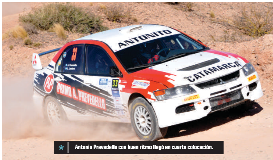
* Antonio Prevedello con buen ritmo llegó en cuarta colocación.