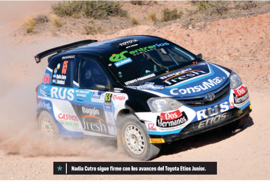
* Nadia Cutro sigue firme con los avances del Toyota Etios Junior.