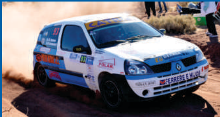
DEBASA, COMO EN CASA.