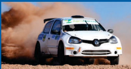
BILBAO Y UN REGRESO EXITOSO.