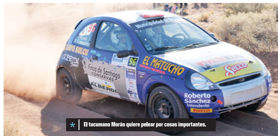
* El tucumano Morán quiere pelear por cosas importantes.