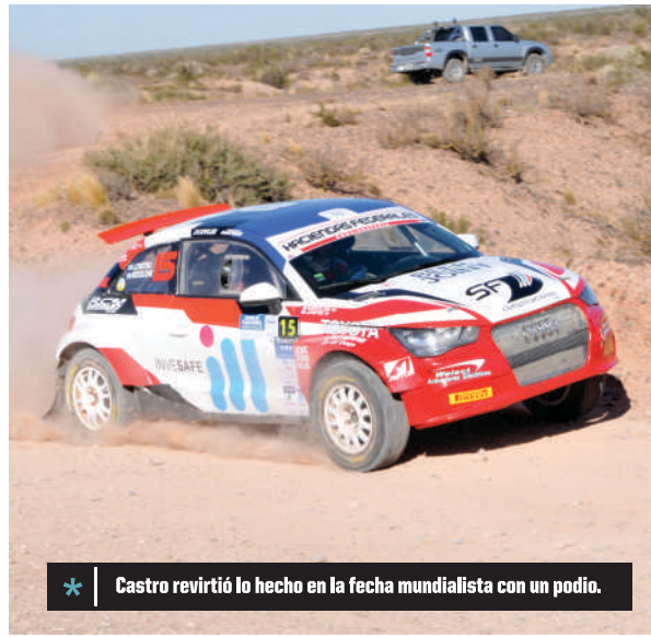
* Castro revirtió lo hecho en la fecha mundialista con un podio.