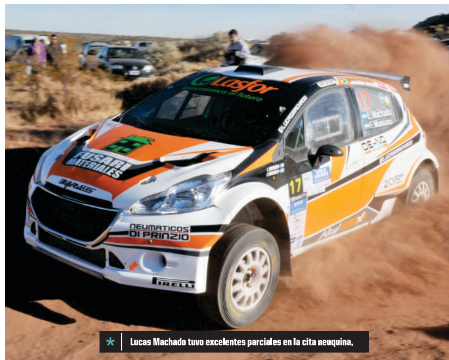
* Lucas Machado tuvo excelentes parciales en la cita neuquina.