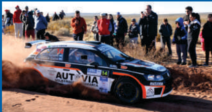
D'AGOSTINI SIGUE VICTORIOSO.