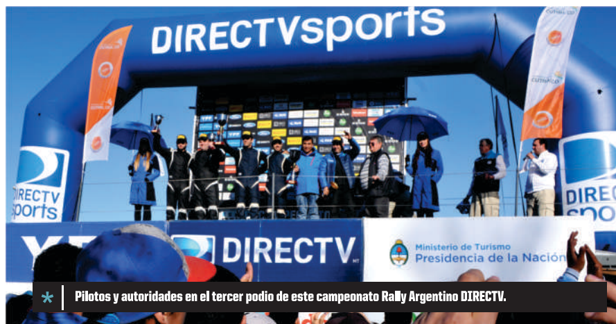
* Pilotos y autoridades en el tercer podio de este campeonato Rally Argentino DIRECTV.