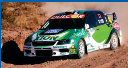
KLUS AHORA DA BATALLA.