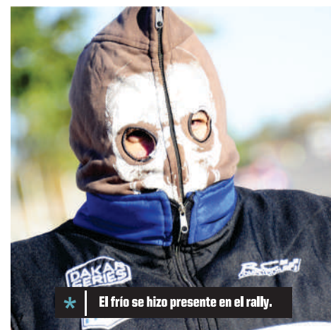
* El frío se hizo presente en el rally.