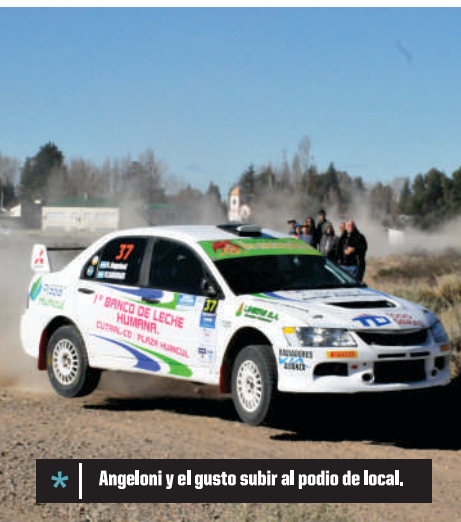
* Angeloni y el gusto subir al podio de local.