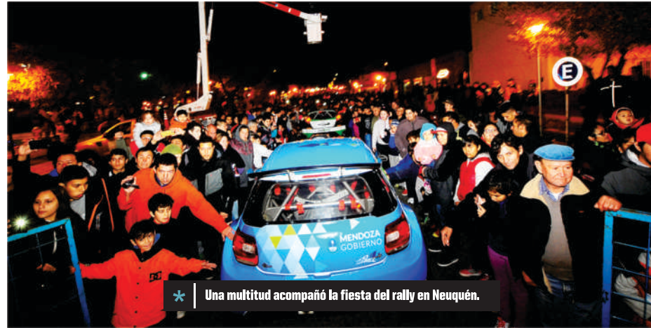
* Una multitud acompañó la fiesta del rally en Neuquén.