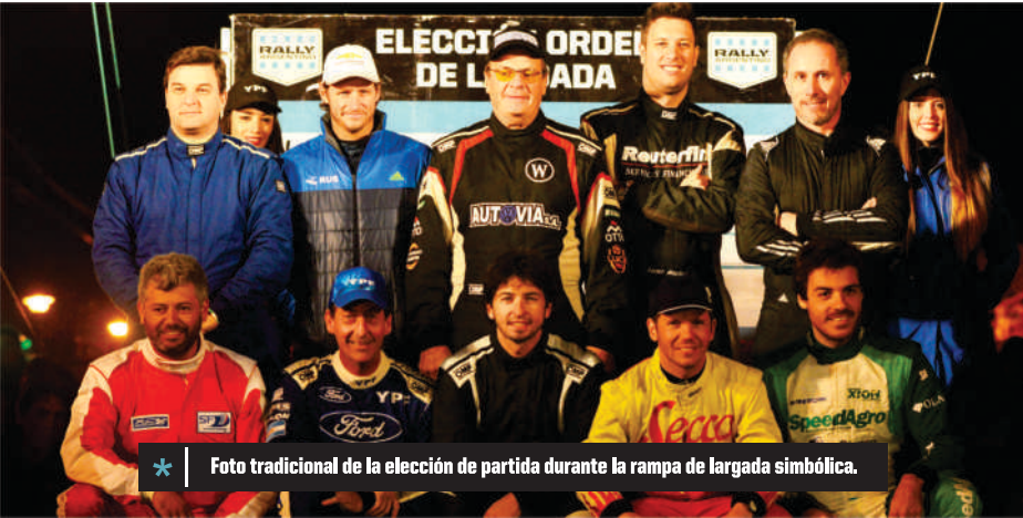
* Foto tradicional de la elección de partida durante la rampa de largada simbólica.