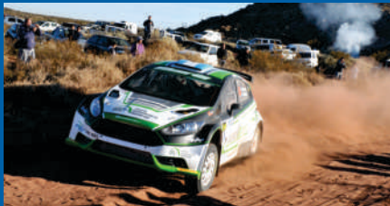
EL MOMENTO DE CADAMURO.