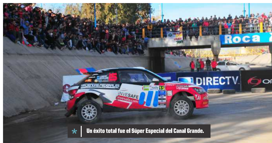
* Un éxito total fue el Súper Especial del Canal Grande.