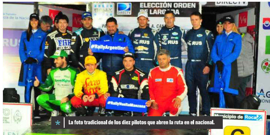
* La foto tradicional de los diez pilotos que abren la ruta en el nacional.