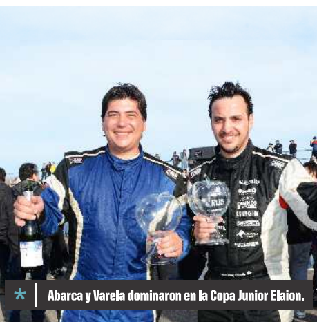
* Abarca y Varela dominaron en la Copa Junior Elaion.