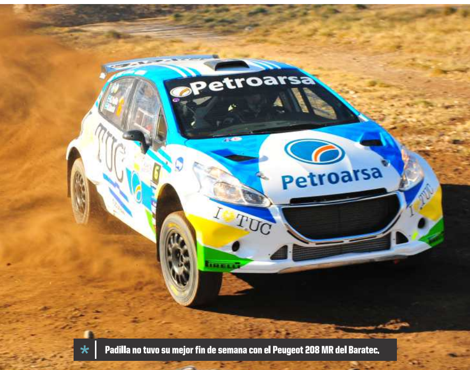
* Padilla no tuvo su mejor fin de semana con el Peugeot 208 MR del Baratec.