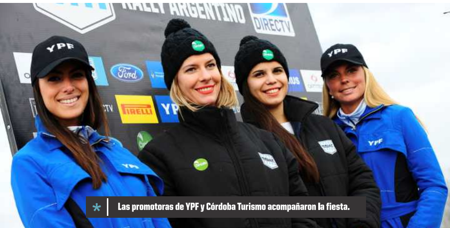
* Las promotoras de YPF y Córdoba Turismo acompañaron la fiesta.