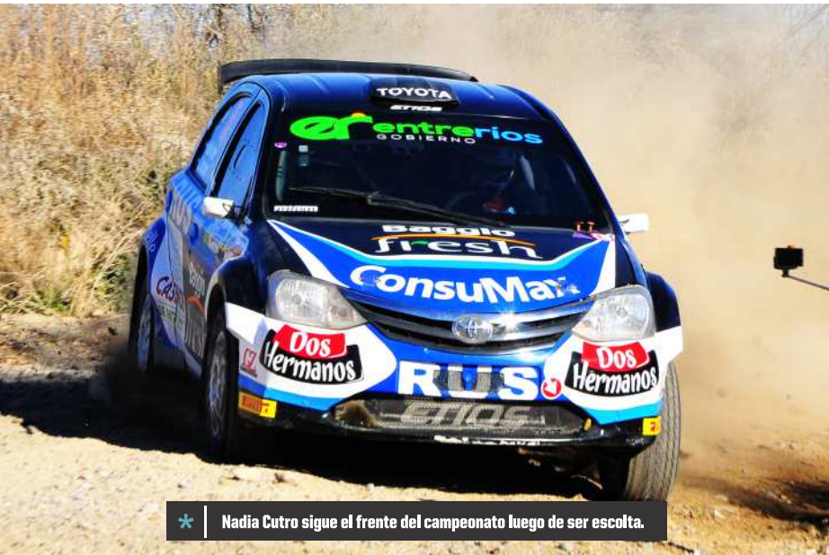
* Nadia Cutro sigue el frente del campeonato luego de ser escolta.