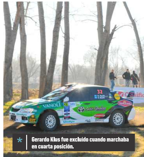
* Gerardo Klus fue excluido cuando marchaba en cuarta posición.