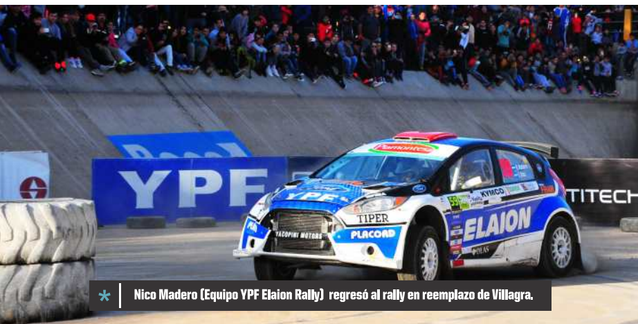
* Nico Madero (Equipo YPF Elaion Rally) regresó al rally en reemplazo de Villagra.