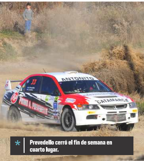
* Prevedello cerró el fin de semana en cuarto lugar.