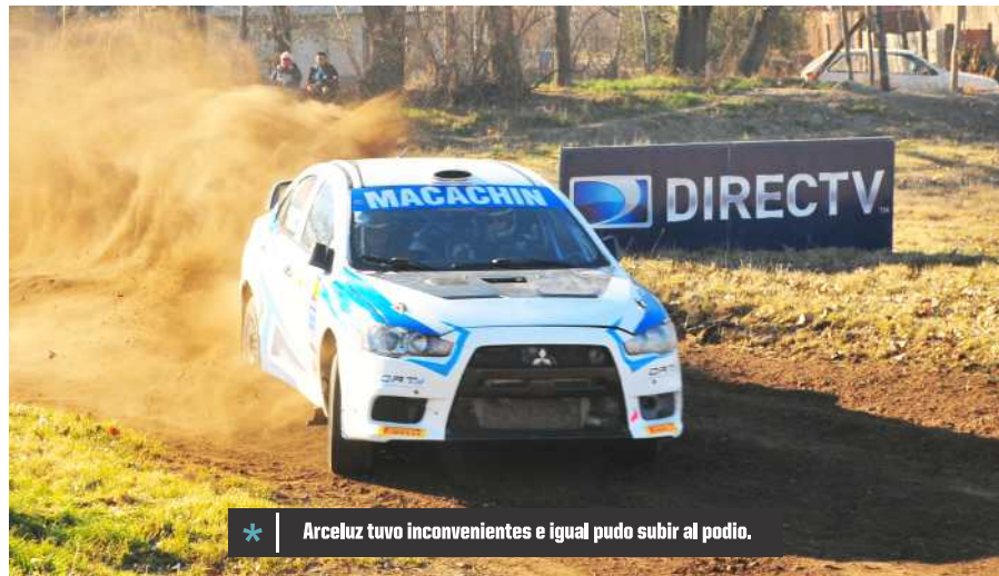
* Arceluz tuvo inconvenientes e igual pudo subir al podio.