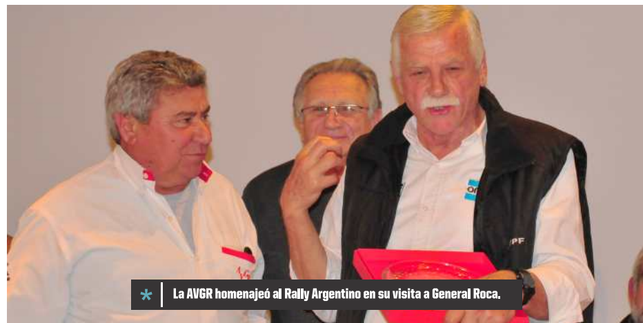
* La AVGR homenajeó al Rally Argentino en su visita a General Roca.