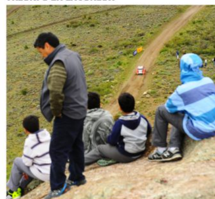
EL PÚBLICO DIO LA NOTA DURANTE TODO EL FIN DE SEMANA DE CARRERA