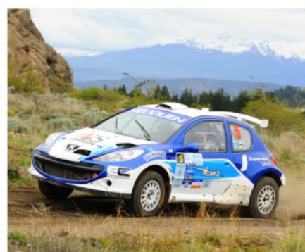
CANCIO COMPLETÓ EL 1-3 DEL TANGO EN ESTA CITA.