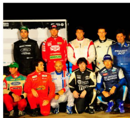
LOS PILOTOS MÁS RÁPIDOS DEL SHAKEDOWN EN LA ELECCIÓN DEL ORDEN DE PARTIDA.