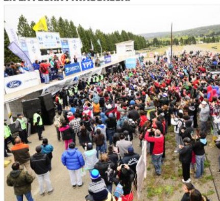
UN PODIO ESPECTACULAR SE VIVIÓ EN EL AUTÓDROMO.