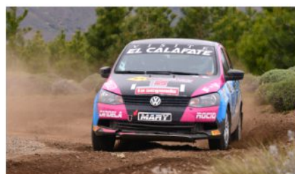
EL SANTACRUCEÑO RIESTRA FUE SEGUNDO CON EL GOL.

caminos y por suerte terminamos contentos. Esto nos da ganas de seguir en el Argentino y siempre que podemos nos sumamos, pero a esto nosotros lo hacemos bien a pulmón", admitió el vencedor.