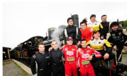
LOS PILOTOS DIERON UN PASEO EN "LA TROCHITA" O VIEJO EXPRESO PATAGÓNICO.