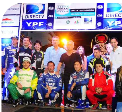
G. RAIES MÚLTIPLE CAMPEÓN ARGENTINO JUNTO A LOS PILOTOS EN LA RAMPA.