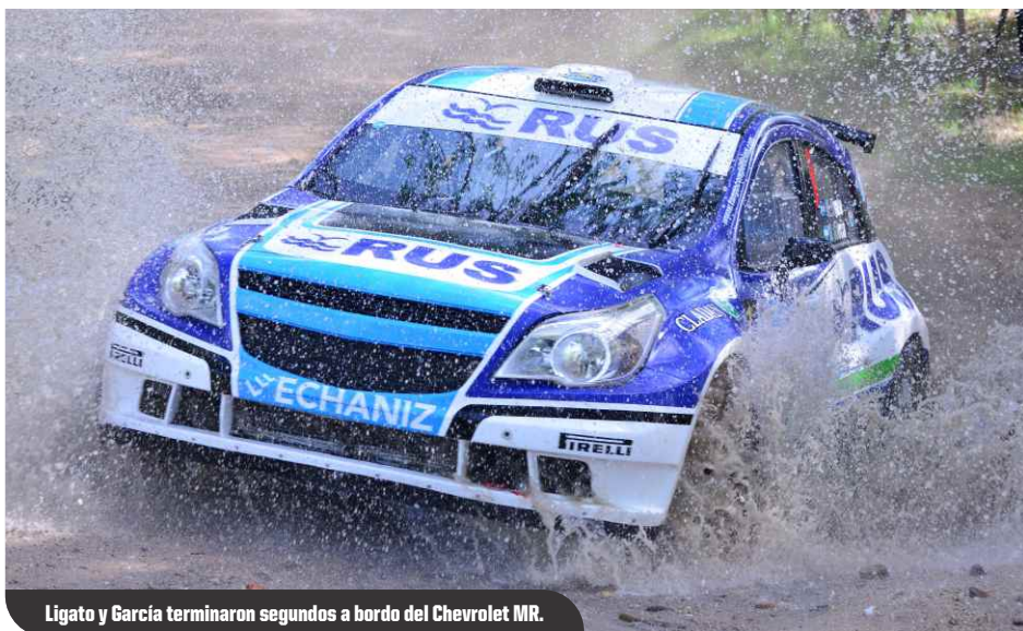
Ligato y García terminaron segundos a bordo del Chevrolet MR.