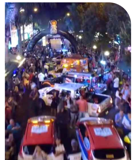
EL PÚBLICO ACOMPAÑÓ LA FIESTA DEL RALLY ARGENTINO EN CARLOS PAZ.