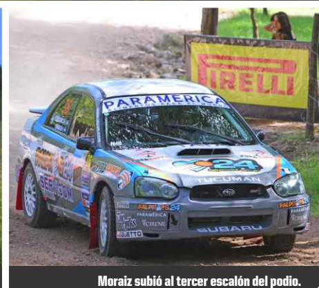
Moraiz subió al tercer escalón del podio.