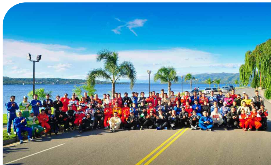
CON EL ESPECTACULAR MARCO DEL LAGO SAN ROQUE, LOS PILOTOS Y NAVEGANTES DEL RALLY ARGENTINO DIRECTV POSARON PARA LA FOTO INSTITUCIONAL 2016.

De esta manera la máxima categoría de tierra de Sudamérica arrancó un nuevo año y ya piensa en su próximo compromiso en Plaza Huincul y Cutral Có del 25 al 27 de marzo.