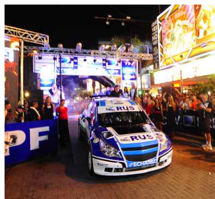
EL CAMPEÓN LIGATO EN LA RAMPA DE LARGADA DE LA PRIMERA FECHA.