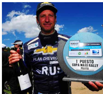
DAVID NALBANDIAN FESTEJÓ SU TRIUNFO CON CHAMPAGNE DE BODEGAS LORCA.