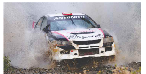
PREVEDELLO SUFRIÓ PERO FINALMENTE LLEGÓ TERCERA.