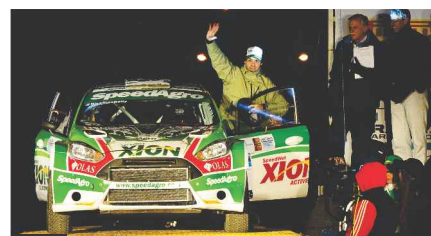
UNA VEZ MÁS MUCHA GENTE ESTUVO LA LARGADA DEL RALLY ARGENTINO.