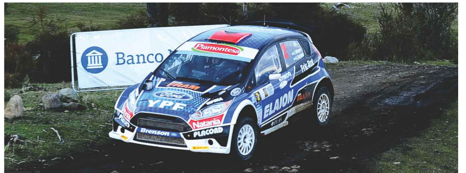
FEDERICO VILLAGRA UNA VEZ MÁS EN EL PODIO. FUE TERCERO CON SU FORD FIESTA MR.