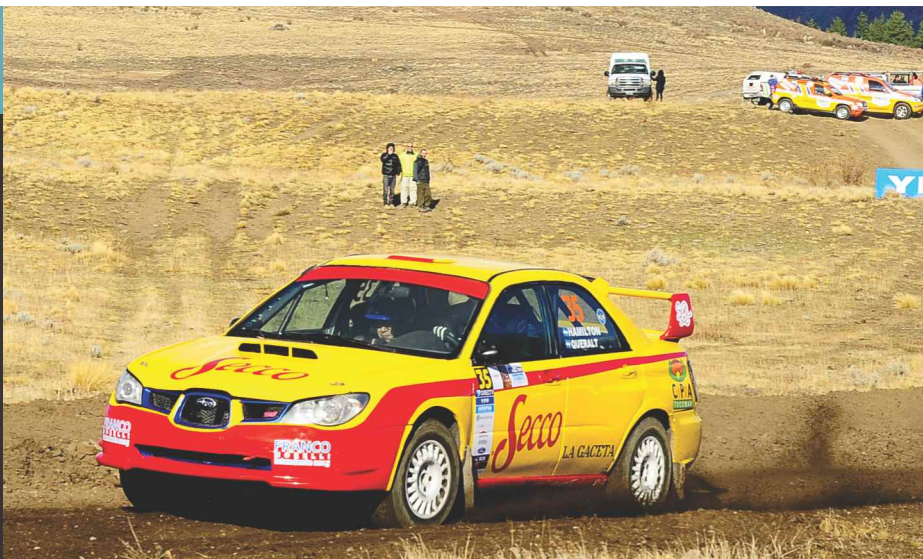
GARCÍA HAMILTON SE HIZO FUERTE DE VISITANTE AL GANAR EN TERRITORIO DE OMAR KOVACEVICH.

El tucumano aprovechó el abandono del local Omar Kovacevich y sumó otro triunfo en este año para escaparse en la punta del torneo.