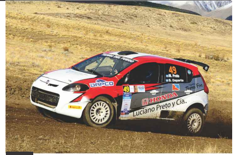
PRETO PELEÓ POR LA VICTORIA, PERO SE RETRASÓ A POCO DEL FINAL CON SU FIAT PALIO.