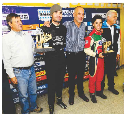
EL GOBERNADOR MARTÍN BUZZI PREMIÓ A LOS GANADORES DEL TRAMO DE ASFALTO.