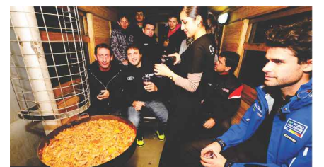
LOS PILOTOS DEL RALLY ARGENTINO CENARON EN LA TROCHITA EN SU 70º ANIVERSARIO.