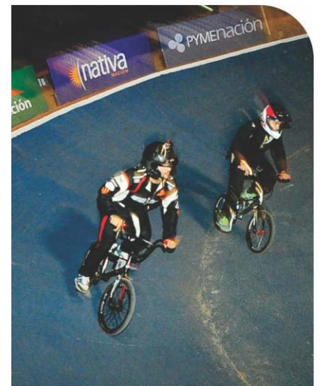
GONZÁLEZ Y D'AGOSTINI HICIERON EL 1-2 EN LA CARRERA DE BMX.