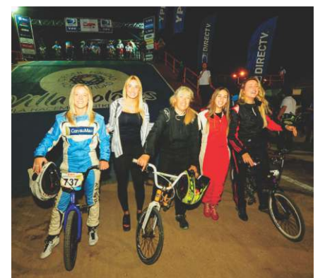
LAS MUJERES EN EL RALLY ARGENTINO SON MULTITUD.