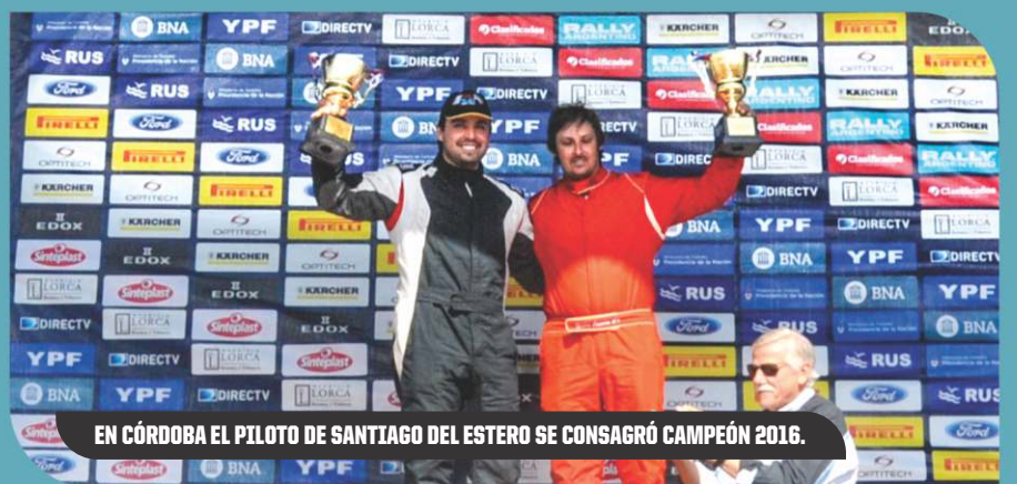
EN CÓRDOBA EL PILOTO DE SANTIAGO DEL ESTERO SE CONSGRÓ CAMPEÓN 2016.