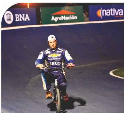
DAVID NALBANDIAN SE SUMÓ A LA INICIATIVA DE CORRER EN BICICLETAS.