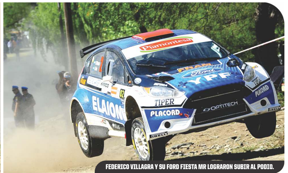
FEDERICO VILLAGRA Y SU FORD FIESTA MR LOGRAN SUBIR AL PODIO.