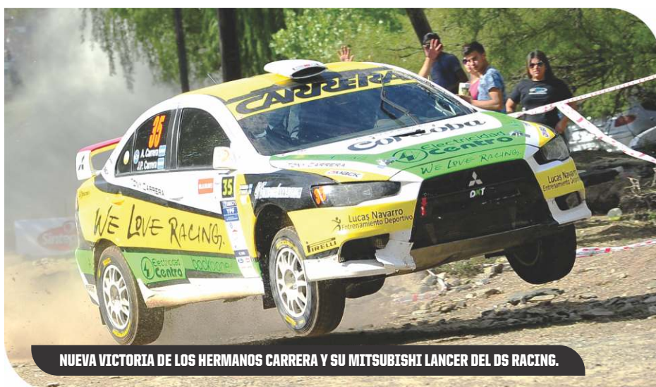
NUOVA VICTORIA DE LOS HERMANOS CARRERA Y SU MITSUBISHI LANCER DEL DS RACING.

1-Peláez, 328 puntos (campeón); 2-Preto, 202; 3-Daparte, 186; 4-Cataldo, 160; 5-Cutro, 113; 6-Monserratt, 102; 7-Chebel, 39; 8-Gambetta, 36; 9-Isanbizaga, 28; 10-Faiella y Nicola, 15.