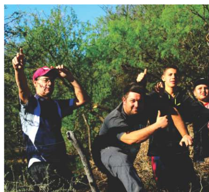
LA PASIÓN DEL PÚBLICO CORDOBÉS POR EL RALLY SIGUE INTACTA.