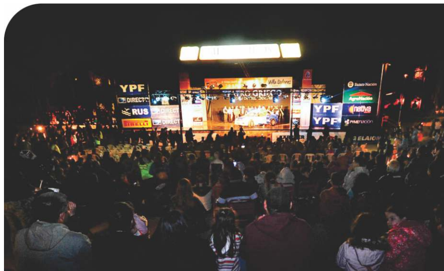
EL TEATRO GRIEGO SE VIO COLMADO DURANTE LA RAMPA DE LARGADA.