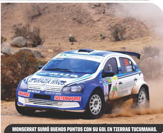
MONSERRATT SUMÓ BUENOS PUNTOS CON SU GOL EN TIERRAS TUCUMANAS.