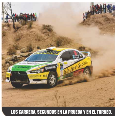
LOS CARRERA, SEGUNDOS EN LA PRUEBA Y EN EL TORNEO.

1-M. Prevedello, 121 puntos; 2-Carrera, 120; 3-Klus, 113; 4-A. Prevedello, 87; 5-Racca, 83; 6-Abarca, 57; 7-Moraiz y Sampayo, 42; 9-Colombo, 40; 10-Angeloni, 39.