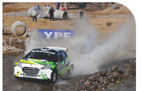
En su provincia, Gerónimo Padilla (208) fue el mejor con los Maxi Rally 1.6 Turbo.