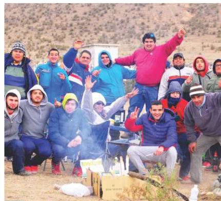
El público tucumano acompañó y le brindó mucho color a esta carrera.