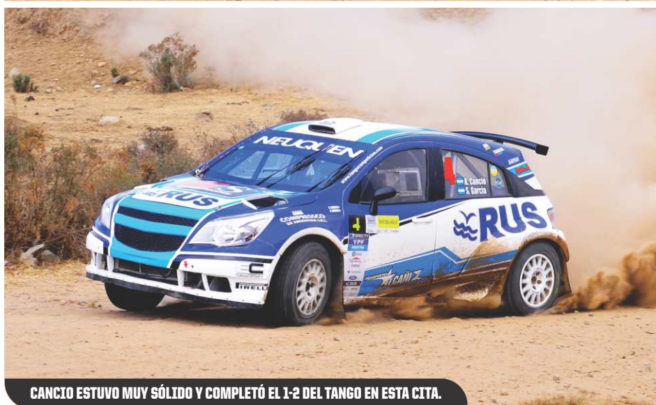
CANCIO ESTUVO MUY SÓLIDO Y COMPLETÓ EL 1-2 DEL TANGO EN ESTA CITA.