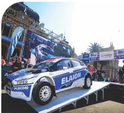
Con la Casa de Gobierno de fondo se realizó la largada promocional.