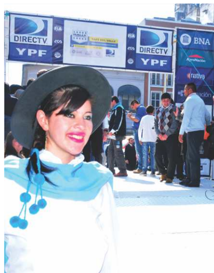
El Rally del Bicentenario brilló en Tucumán.