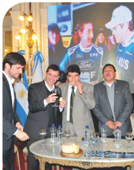
Las autoridades provinciales le dieron el aval a esta competencia.

Tafí del Valle recibió por primera vez al Rally Argentino DIRECTV y lo hizo de la mejor manera. Los caminos de los Valles Calchaquíes estuvieron a la altura de las circunstancias y la organización brilló en todas sus áreas. Sin lugar a dudas Tucumán volvió con todo a la escena del rally nacional con una carrera que quedará en la memoria de todos. La próxima del Argentino será a mediados de agosto, con la tradicional Vuelta de la Manzana en General Roca, Río Negro.