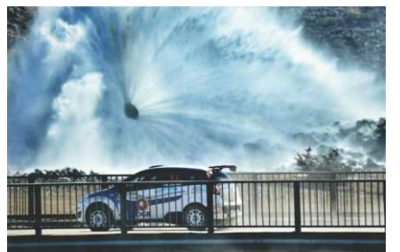
Impresionante postal en los caminos tucumanos.