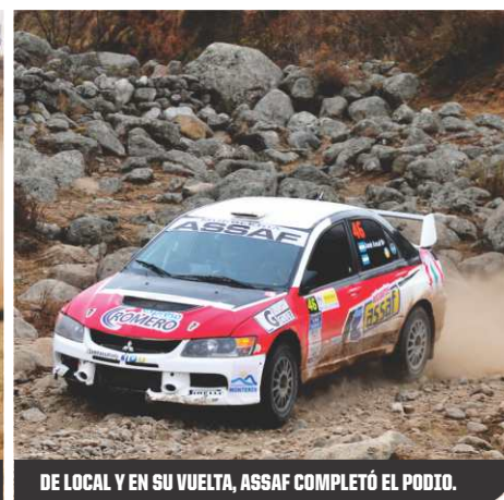
DE LOCAL Y EN SU VUELTA, ASSAF COMPLETÓ EL PODIO.