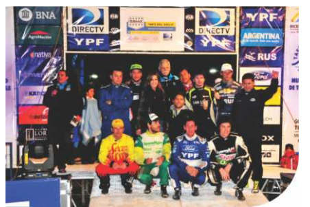
Foto tradicional: pilotos, autoridades e invitados VIP en la rampa.